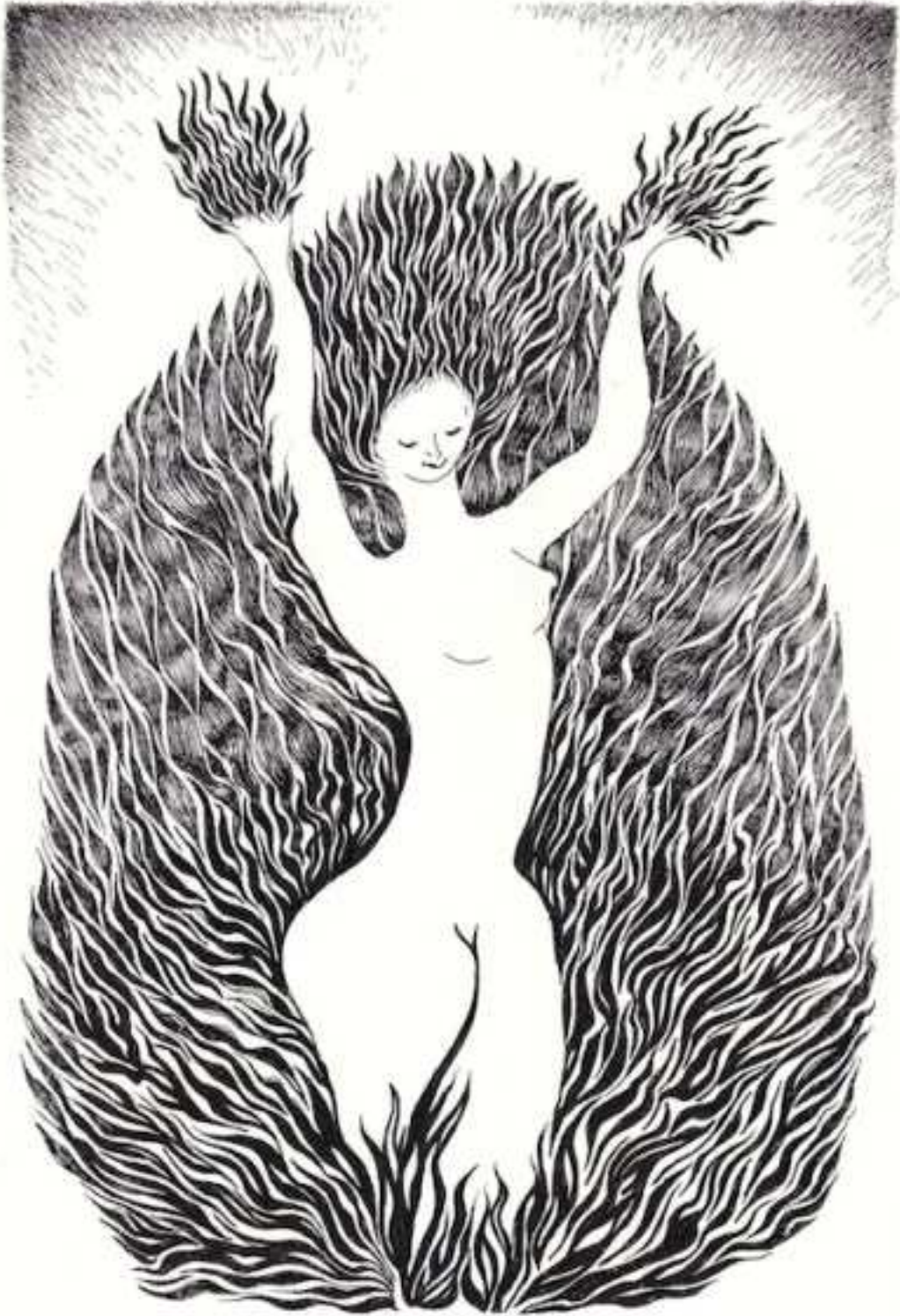
Vénus des flammes