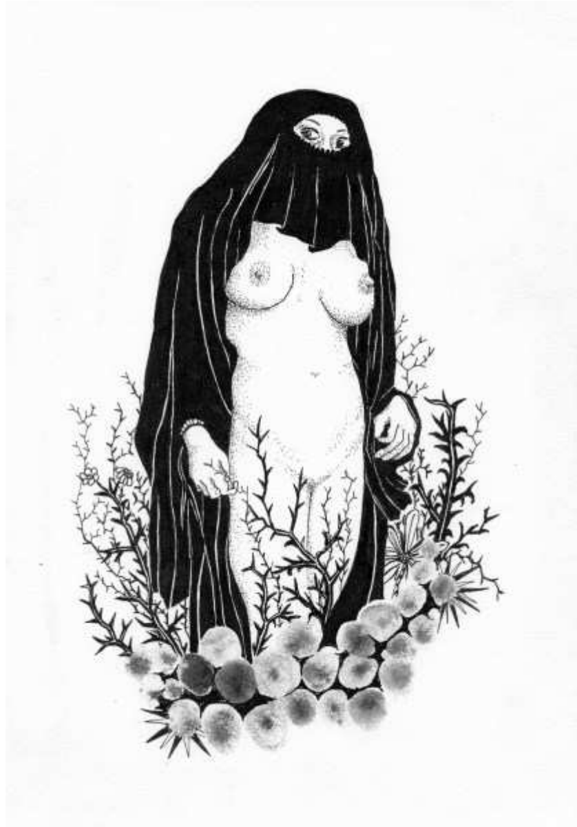
Vénus au désert