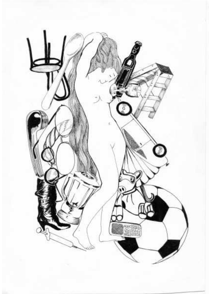
Vénus des arts ménagers