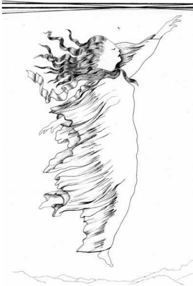
Vénus du vent