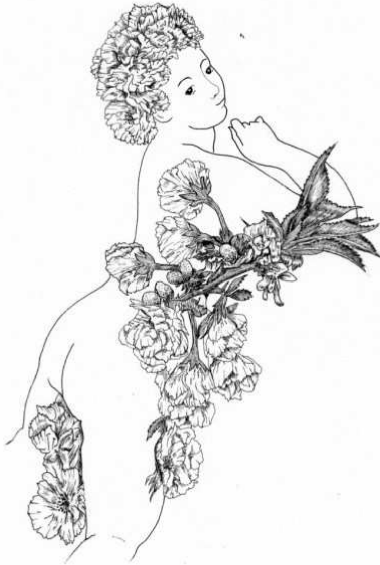
Vénus du cerisier