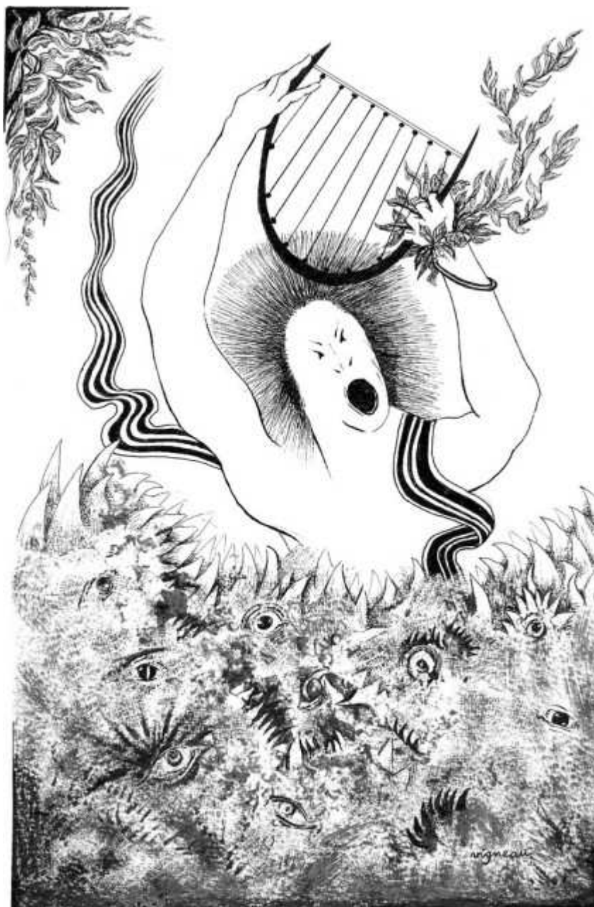
Entrevue de la musique aux Enfers