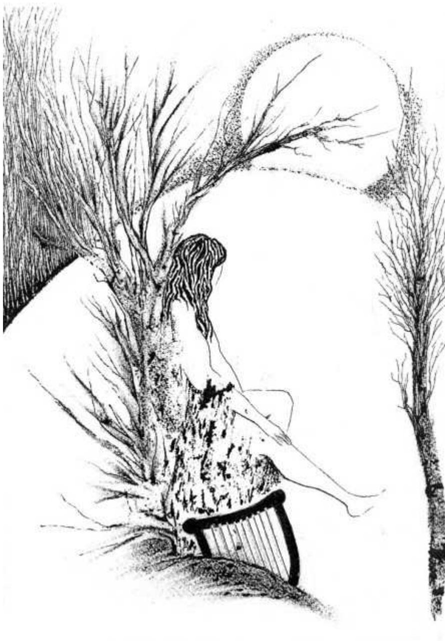
Sur le chemin des Enfers