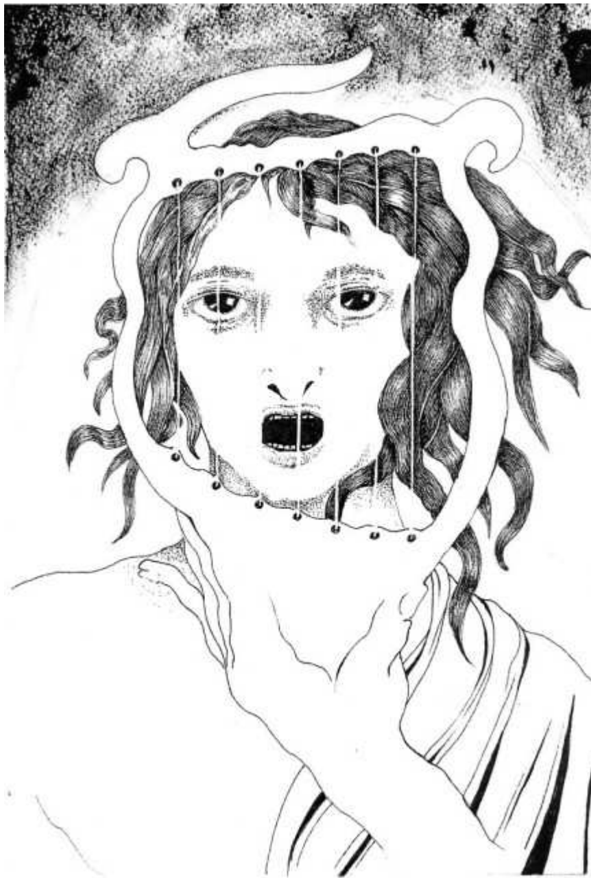
Orphée devant Hadès