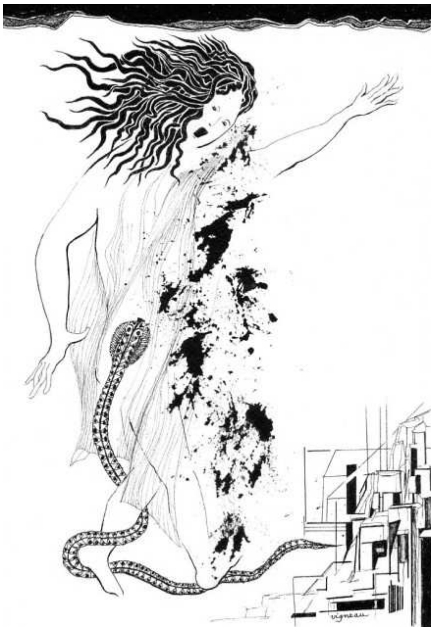
Le serpent du jaloux