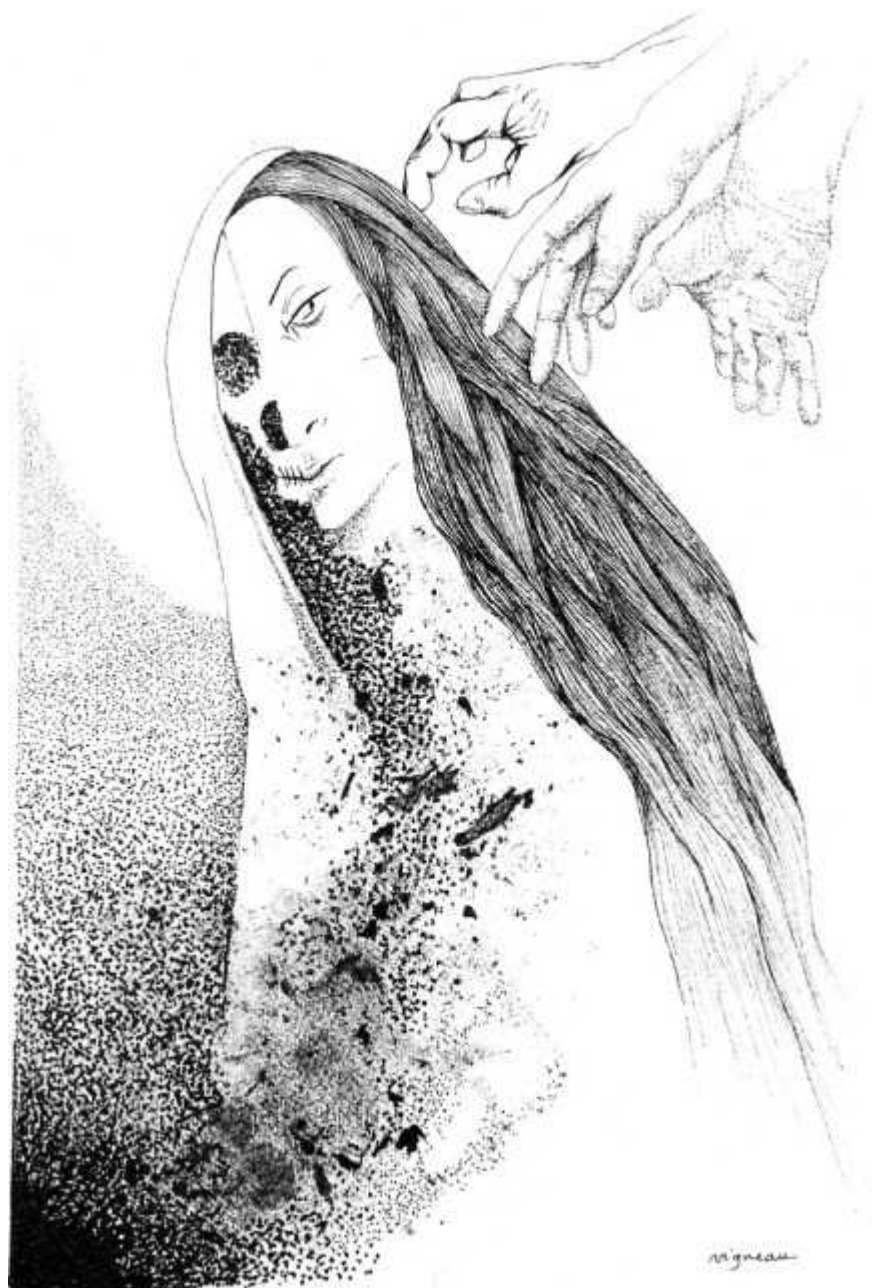
Seconde mort d'Eurydice