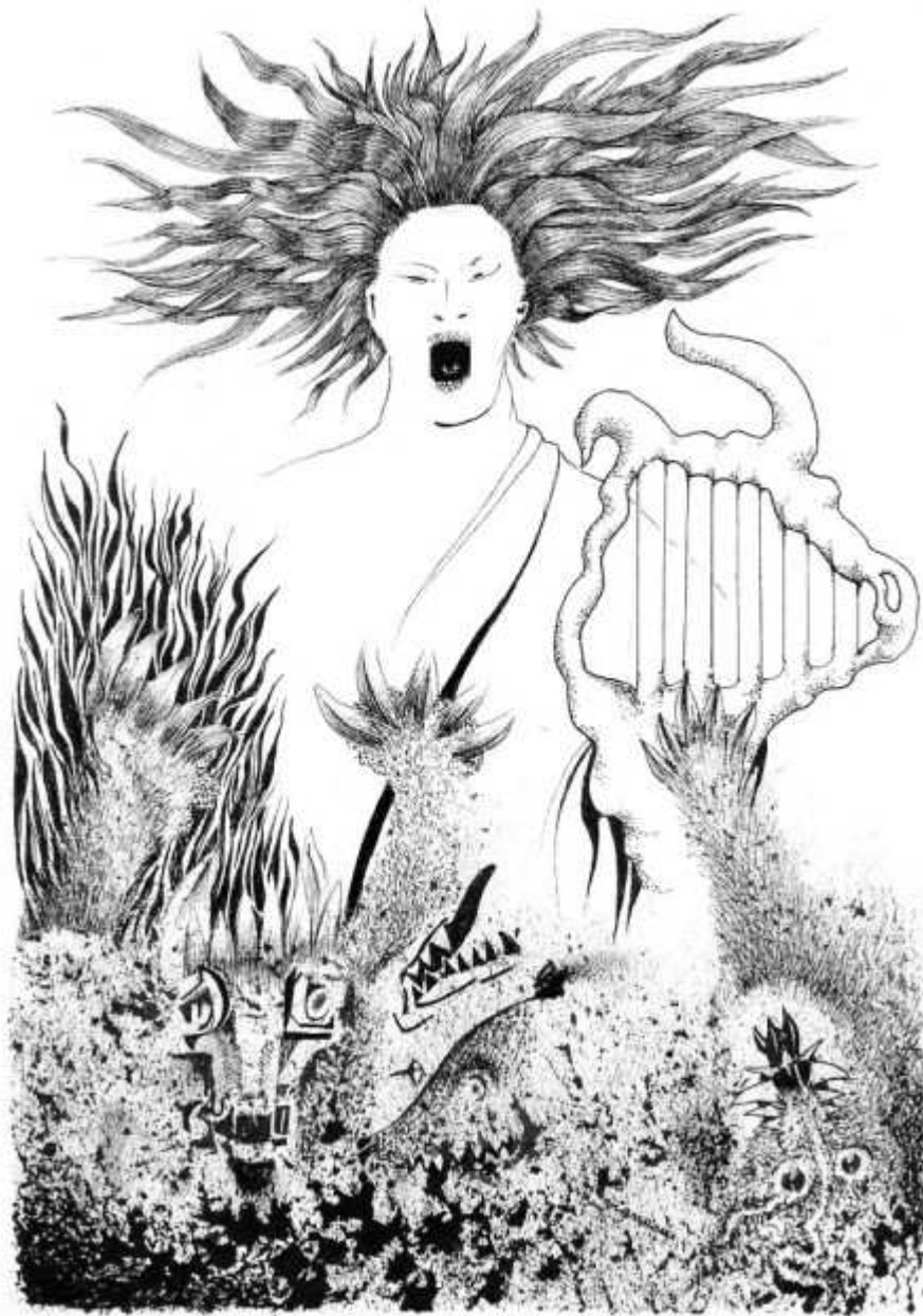
Chant devant les Enfers