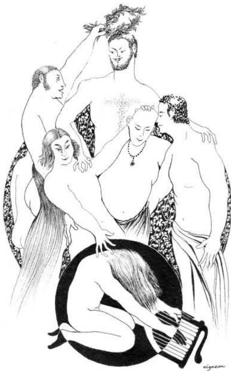
Orphée au Rhodope