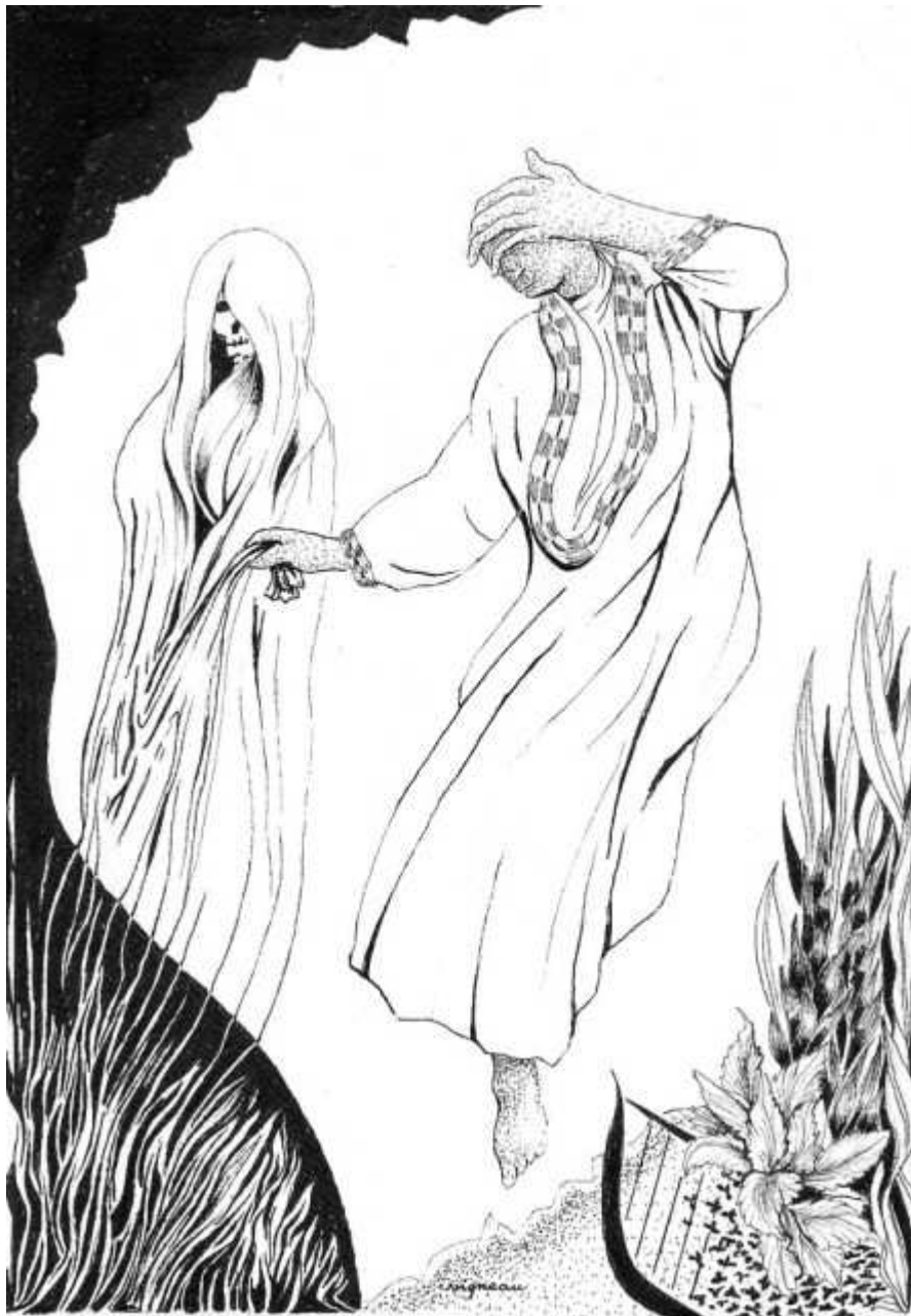
Hors des Enfers