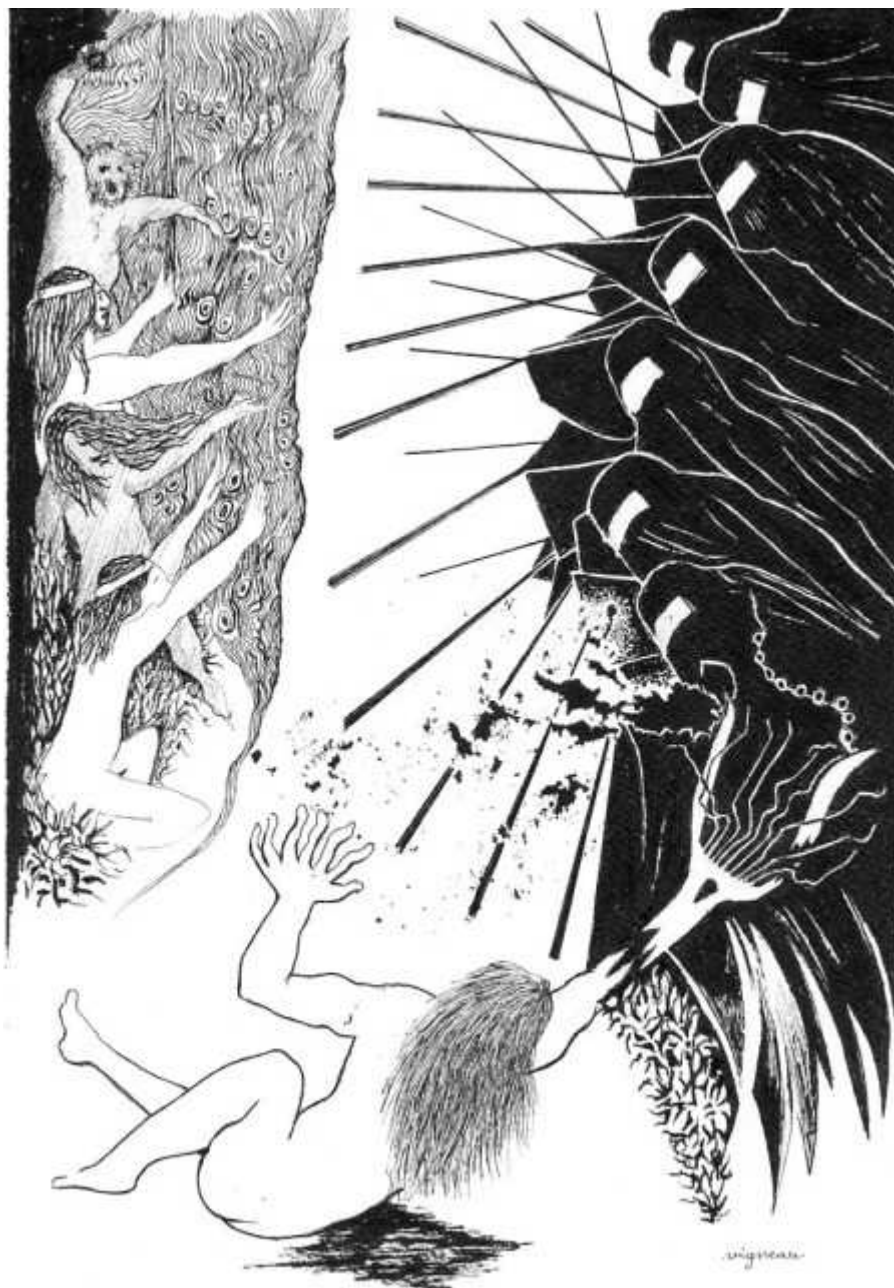
Orphée mis à mort