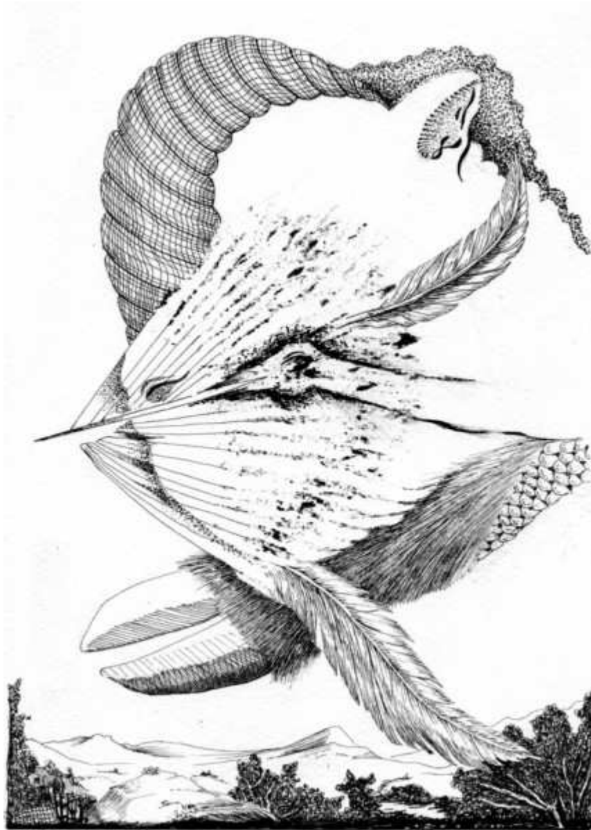
Les hésitations du vivant