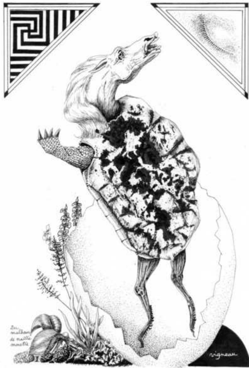
Du malheur de naitre