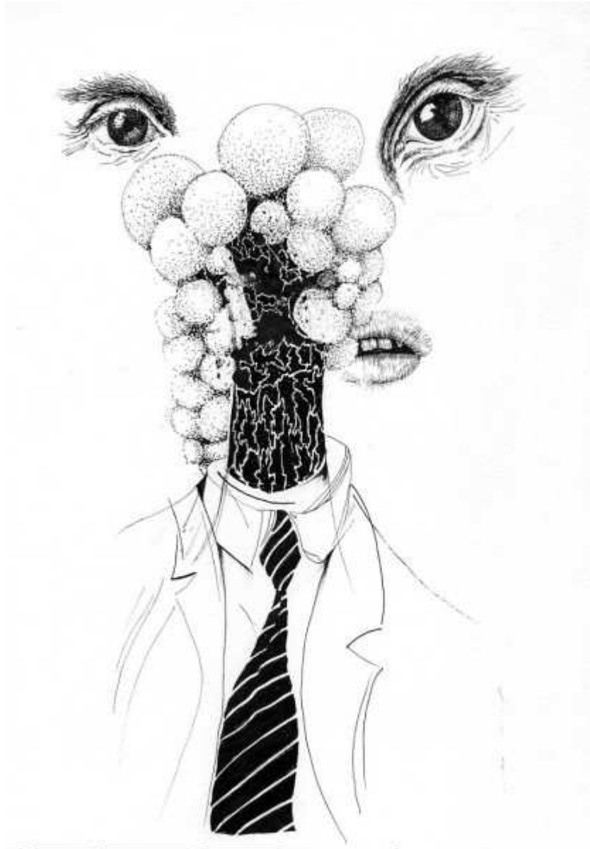
Le col blanc