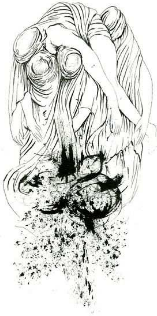
Etreinte en Kabylie.