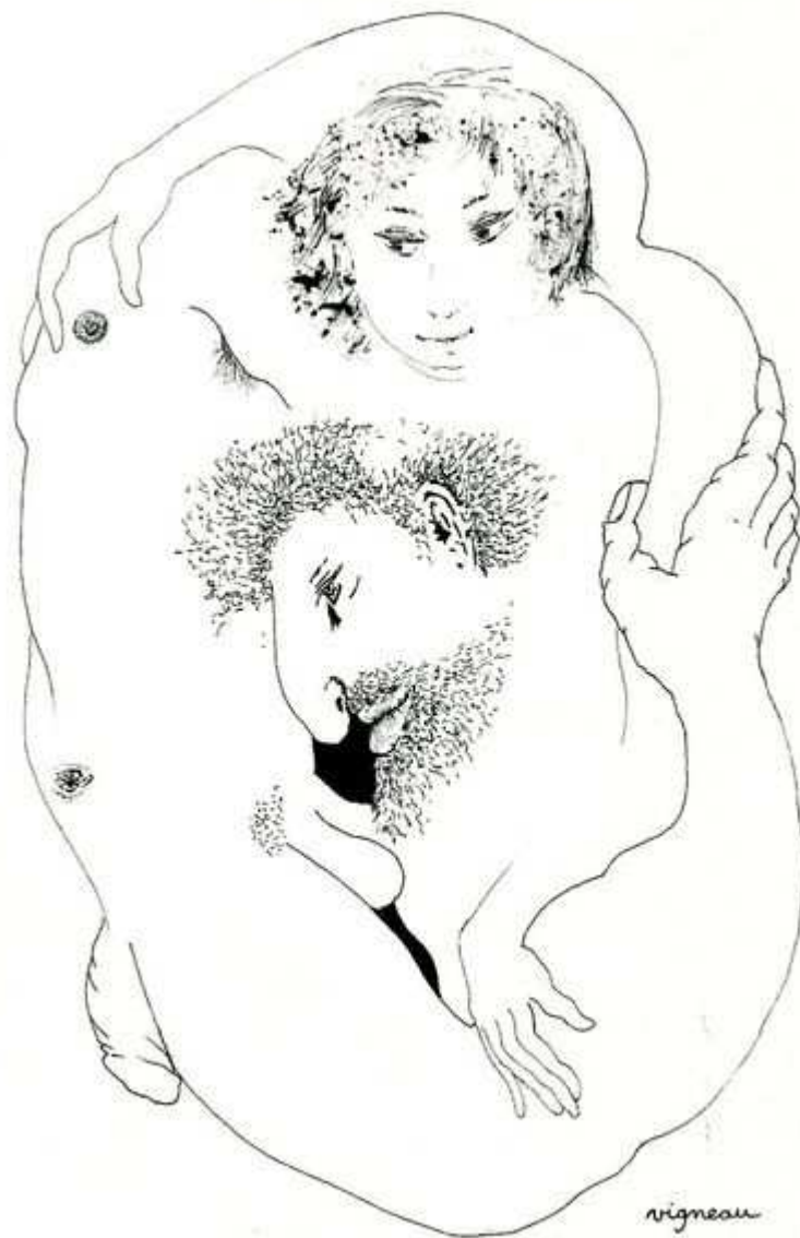
Tendresse après l'amour.