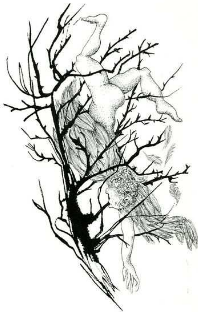
Etreinte d'un arbre.