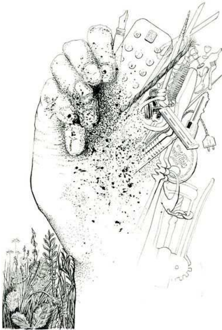
Nature / artifice.