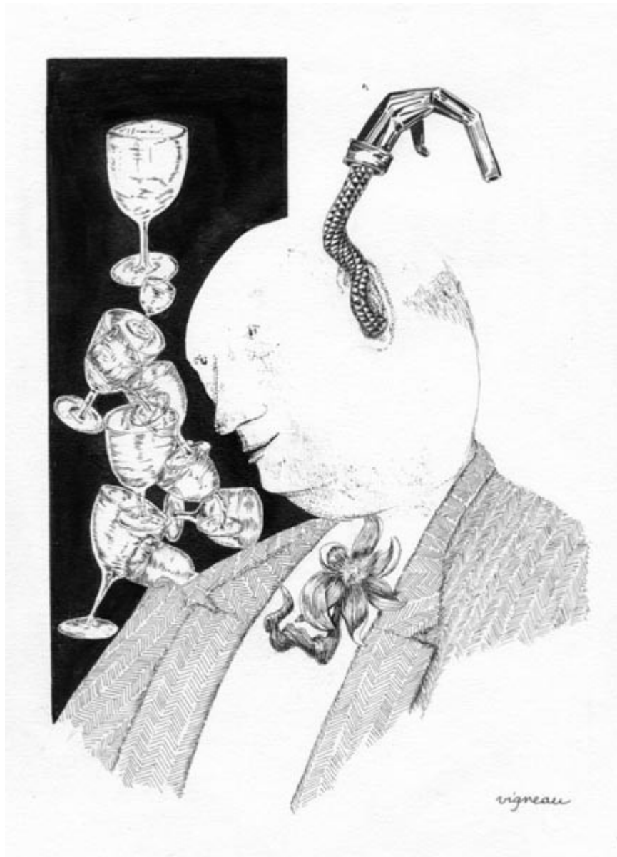
Le pochard à pochette