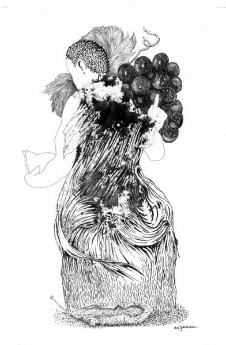
Hamadryade d'un cep